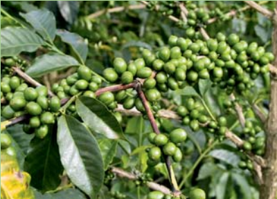
TaCRI inaendeleza aina mpya ya kahawa inayotoa mavuno mengi na isiyoshambuliwa na magonjwa.

Ili asasi au biashara yoyote iweze kufanikiwa ni muhimu kuwa na mtazamo ulio wazi utakaoweza kupanga shughuli na kupima mafanikio.