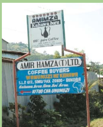
Biashara ya zao la kahawa ni shughuli muhimu

TaCRI itanufaika pia na riba kutokana na fedha za STABEX zitakazowekwa kwenye akiba maalumu.