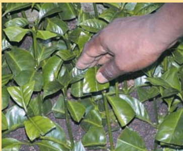
Utunzaji wa vikonyo kwenye visanduku ilivitoe mizizi

Moja ya jukumu muhimu la TaCRI ni utoaji na usambazaji kwa wingi wa aina bora za kahawa zinazotoa mavuno mengi, zinayostahimili magonjwa na zenye ubora wa kutosha.