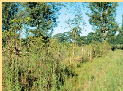
Kulia: Shamba lililotelekezwa, Lyamungu