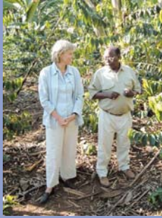
Uchanganuzi wa wadau

magonjwa (zote Arabika na Robusta), pamoja na kuzialisha kwa wingi na kuzisambaza vizuri kwa wakulima kuzitathmini katika mifumo mbalimbali ya uzalishaji kahawa (maeneo ya ikolojia); mifumo jumuiishi ya gharama nafuu ya kudhibiti wadudu waharibifu, udhibiti wa virutubisho vya kioganiki na visivyo vya kioganiki ikiwa ni pamoja na utoaji wa huduma za uchanganuzi wa udongo na majani (kibiashara) na teknolojia ya usindikaji wa mwanzo ambayo inafaa kwa matumizi ya ngazi ya shamba. Matokeo yatakuwa ni kupunguza gharama za uzalishaji, kuongeza tija na ubora ili kuifanya kahawa ya Tanzania kuwa na ushindani na hatimaye kuongeza pato na faida.