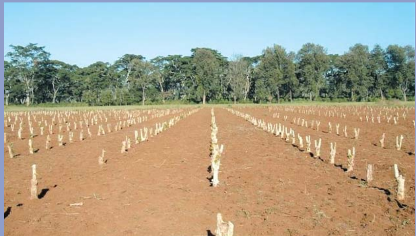
Ukataji mkali unatakiwa ili kurekebisha majaribio ya utafiti yaliyotelekezwa

Kwa kifupi, eneo hili la utafiti linaweza kufupishwa chini ya kichwa cha habari "Uhakika wa Kipato" kuelezea mahitaji ya kufanya utafiti utakaolenga maisha yanayoendeshwa kwa fedha na siyo teknolojia tu ambayo wakulima wanaweza au kutoweza kuimudu. TaCRI itashawishika na mahitaji haya ijapokuwa haikuwa kawaida hapo zamani kuiweka katika udhamini wa taasisi za utafiti wa mazao wa jadi.