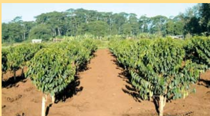
Juu: Jaribio lilokarabatiwa

na muonjo mzuri. Aina hizi mpya zitazalishwa kwa wingi kwa miaka mitano kwenye pragramu kabambe ya taifa ya kupanda kahawa upya inayotarajiwa kuanza 2007. Mpango wa kutoa aina bora za kahawa utaimarishwa kwa kuteua wataalamu wapya kwenye taaluma hii wenye uzoefu pamoja na misaada ya kitaalamu ya kikanda na kimataifa.